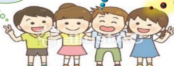
1年中やっていてほしいです。