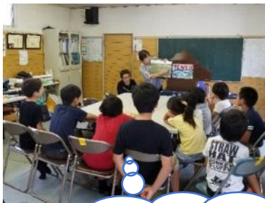
座間ふるさとガイドの会の方達が紙芝居をしてくれました。