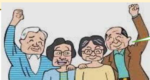
次回も 期待してネ!!