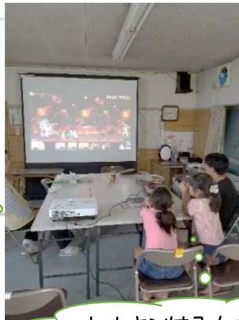
ヒカキンはみんな大好き

一方見守る大人については、特に時間割や当番制としなかったが、児童見守り隊の方達や民生児童委員、その他地域で子供の好きな方たちが、時間の許す範囲で来ていただき、毎日2~3名が参加してくれました。写真でも分かるように世代間の交流が楽しくできました。