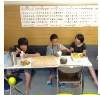
かき氷を食べれてよかった

地域の方々が、お菓子・麦茶・すいか・自家製アイスクリーム・かき氷の機械と氷・シロップも差し入れて頂き、子供たちは毎日喜んでいました。