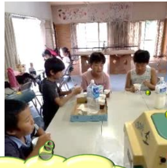
お菓子がいっぱいあって良かった。