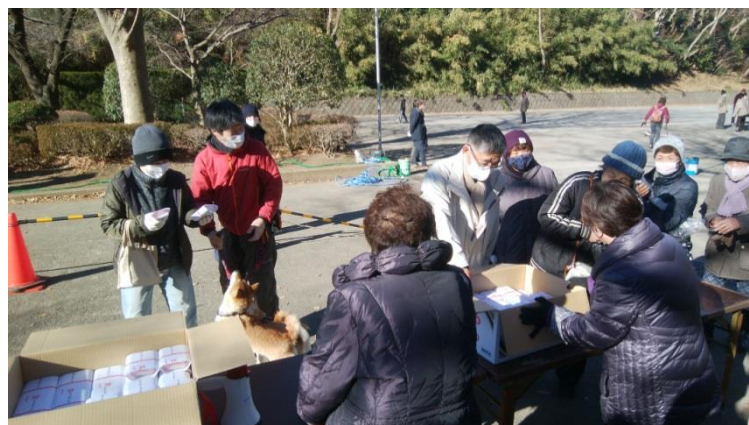
手渡しせず個人個人が箱から紅白饅頭を受け取る。