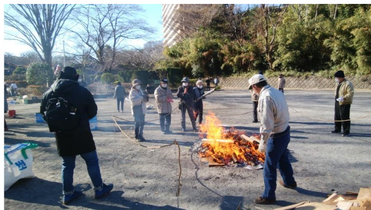
お飾り・注連縄などを焚き上げる。