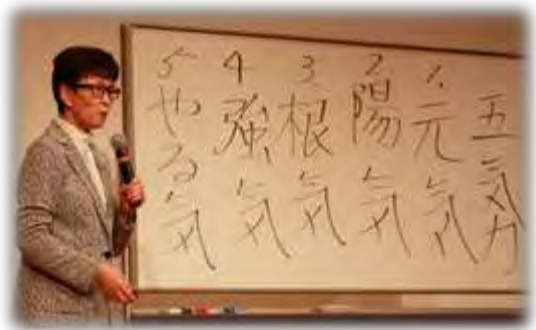
自治会役員の心得 (五気力)

自治会活動に伴う課題解決の糸口になりそうなお話がたくさんありました。 参加者のみなさんの自治会で、ぜひ参考にさせていただきたいです。