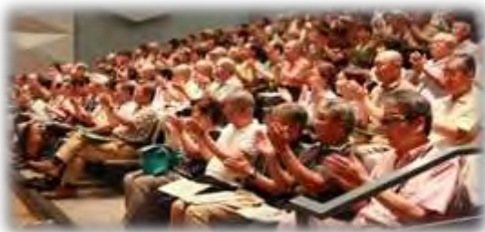
熱心に聞き入る参加者