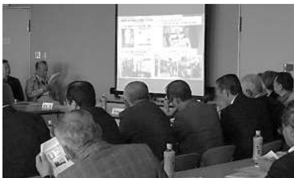
プロジェクターを使用した説明

意見交換のなかで自治会運営の話も出て、習志野市の行政主導の運営体制に対し、市自連が事務局も含め行政から独立した体制であることに興味と関心が寄せられました。