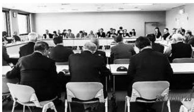
活発な意見交換の様子

※11月下旬に市自連理事は長野県松本市町会連合会を訪問します。 若年層向けの加入促進のノウハウがある連合会で、若い世帯向けの加入のアプローチの仕方などを中心に意見交換をしてきます。