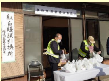
紅白饅頭を配布しました