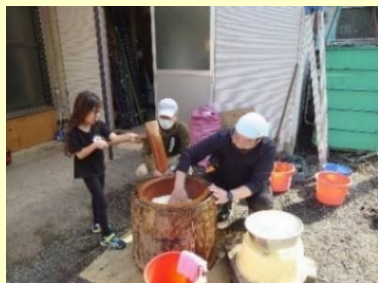
おもち美味しそうだね！

会員には引換券による「紅白饅頭」の配布や「おしるこ」の無料提供を行い、地区社協や関連団体の皆さんの協力による「ポップコーン」の配布、子ども向けの「スマートボール遊び」や「お絵描き」の遊びの場も設けました。家族連れを含む多くの会員の方々にご来場いただきました。