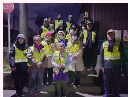
お忙しい中ありがとうございました