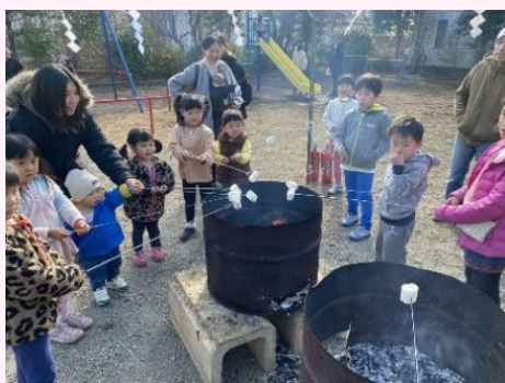
マシュマロもあるよ！

最初に星の谷西自治会長の挨拶で能登半島地震の犠牲者に参加者全員黙とうをしました。会員の皆様にココアやミカン、ジュース、お酒やつまみを用意し、お子様にはお菓子を用意しました。