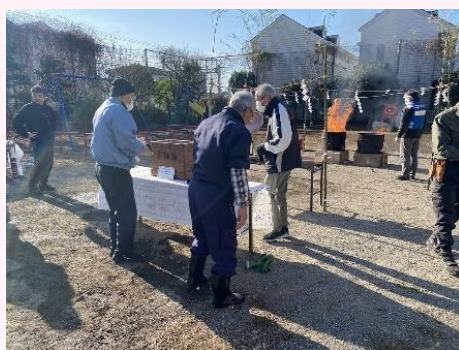
募金のご協力ありがとうございました