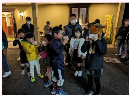
スーフでお疲れ様！

相模が丘地域は住宅密集地で火災に対しぜい弱であると認識して十分な予防意識が必要です。パトロールが、地域の防火意識をより高めることにつながると思います。