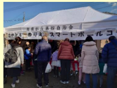
子ども向けの遊び場も！