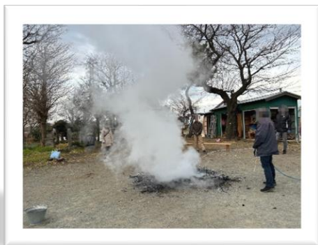
最後は安全に気を付けながら鎮火です。