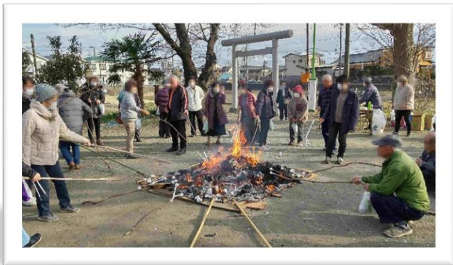
お団子 うまく焼けるかな？