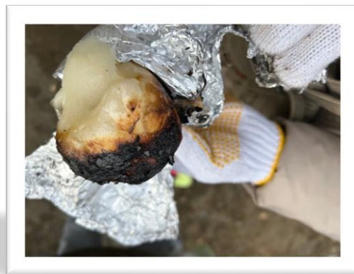
これは焼けすぎですね。