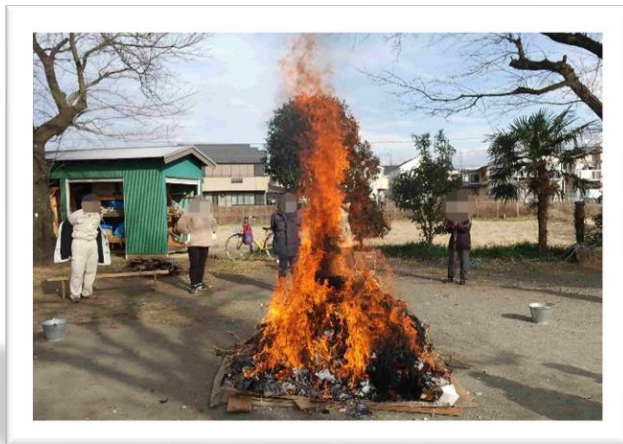
火の勢いがすごいですね。